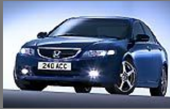
Honda Accord 2.0 Sport

Ultima edición por Toledano el Fri Jul 02, 2004 8:18 am, editado 1 vez