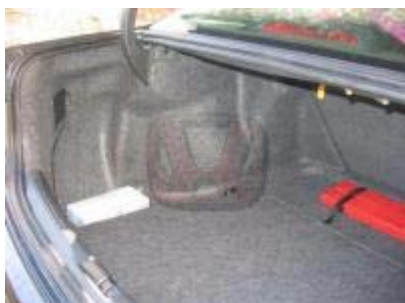
Escalón lateral izquierdo.

En estas dos últimas fotos se puede apreciar el escalón que queda, que ayuda también, para que los pequeños objetos no vayan dando tumbos por el maletero, cuando va medio vacío: