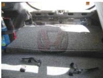
Cambio de tapizado visto desde los asientos traseros abatidos.

Se empieza cortando el tapizado por el pliegue transversal y suplementando, con tela del mismo tipo (la que tenía mi tapicero era idéntica a la que montan los Accord), para adaptar la tapa a la nueva altura, cubriendo el hueco que dejaría, tal como se aprecia en la foto.