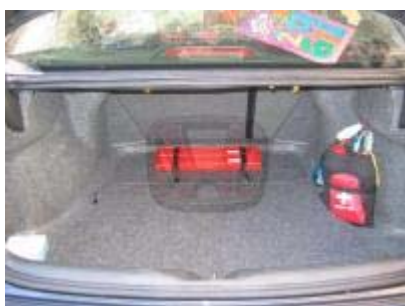
Modificación del tapizado terminada.

Aquí se puede ver todo lo que queda debajo de la tapa, incluidos cuatro velcros en las esquinas, para fijar la tapa una vez cerrada.