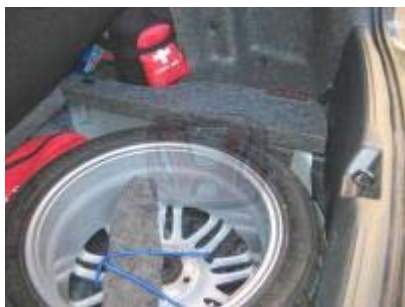
Tapizado de los laterales con cojines de espuma para nivelar el fondo.

Se empieza cortando el tapizado por el pliegue transversal y suplementando, con tela del mismo tipo (la que tenía mi tapicero era idéntica a la que montan los Accord), para adaptar la tapa a la nueva altura, cubriendo el hueco que dejaría, tal como se aprecia en la foto.