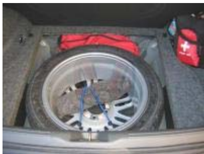
Base de espuma y rueda con llanta.

Aquí se puede ver todo lo que queda debajo de la tapa, incluidos cuatro velcros en las esquinas, para fijar la tapa una vez cerrada.