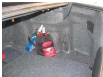
Escalón lateral derecho.

Espero que os guste y os sea práctico. El tapicero me cobró 80€ por la modificación y a ello tendréis que sumarle lo que cuesta la rueda y el neumático, aunque si tenéis las de origen, hay bastantes foreros que se están desprendiendo de ellas, una vez montadas las llantas de 17" y es fácil encontrar algunas a muy buen precio.